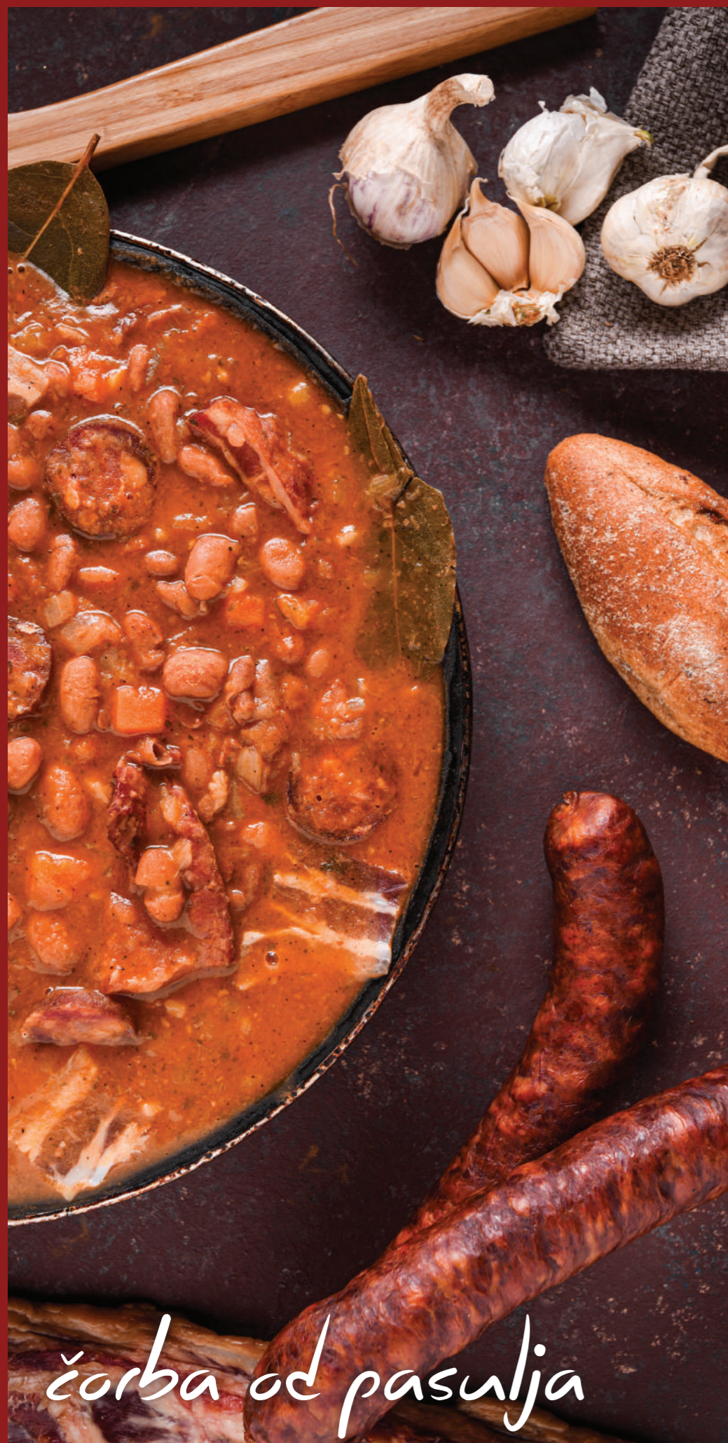
čorba od pasulja