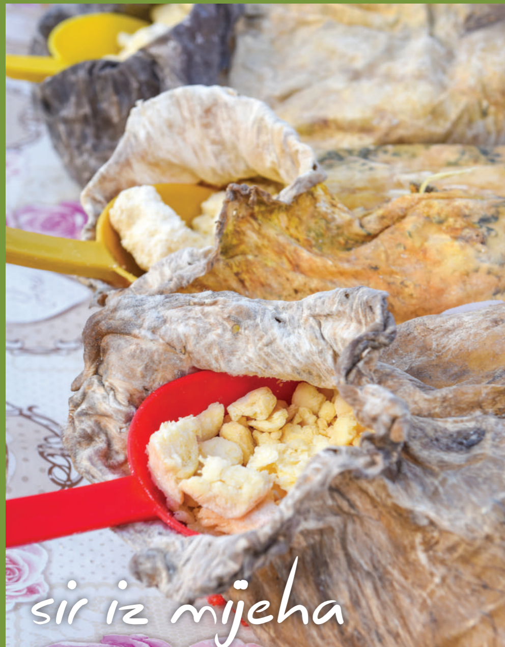
sir iz mijeha